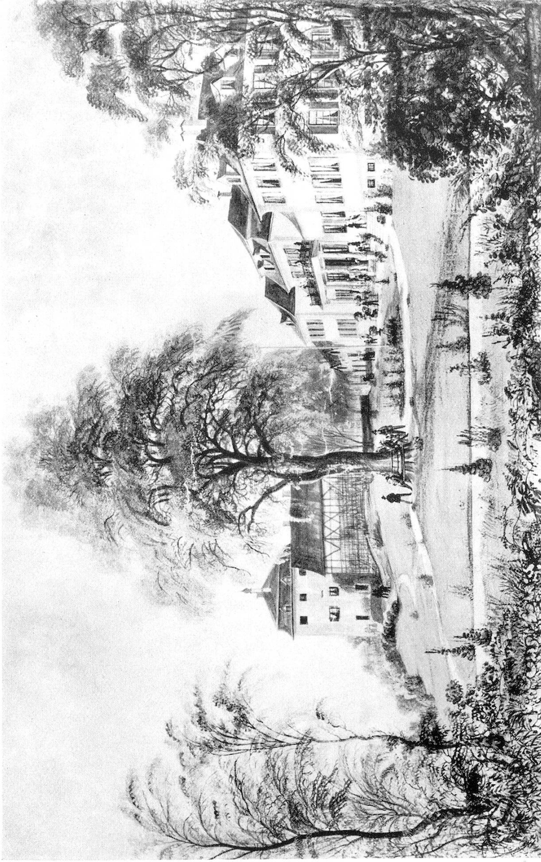
Hotel-Pension Schloß Wolfsberg um 1870

Nach einer Gouache von Jakob Eggli in der graphischen Sammlung der Zentralbibliothek Zürich